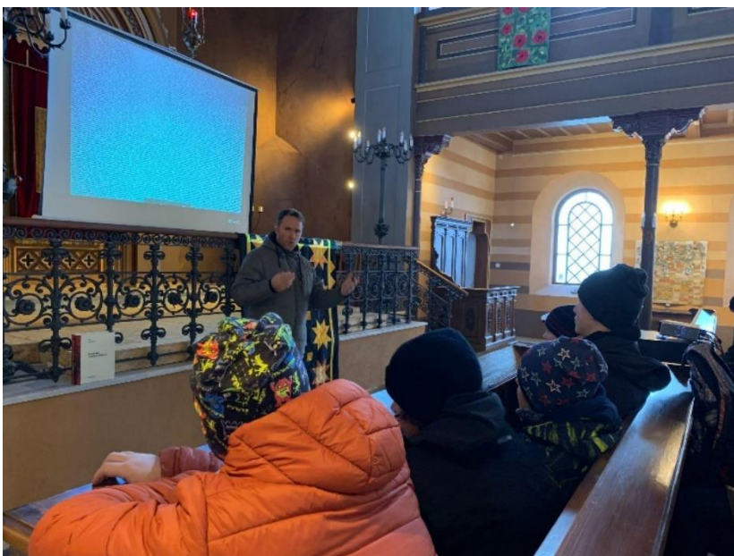
Návštěva synagogy - Den holocaustu III. T