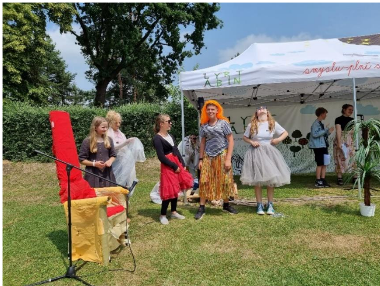
Zahradní slavnost a divadelní představení Odyssea