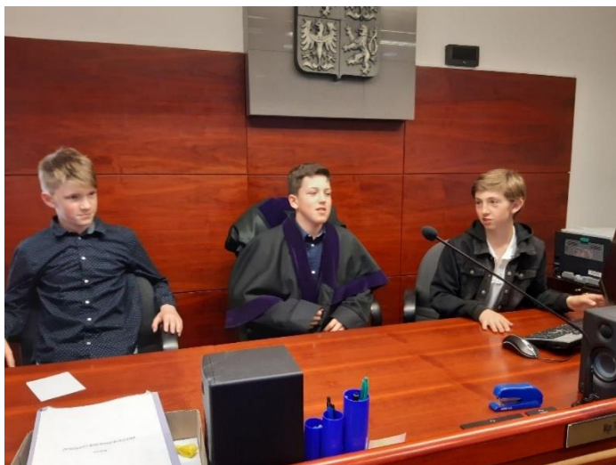
Návštěva okresního soudu v Ostravě III. T