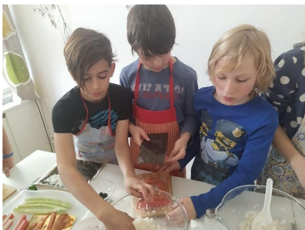
Den s šéfkuchařem