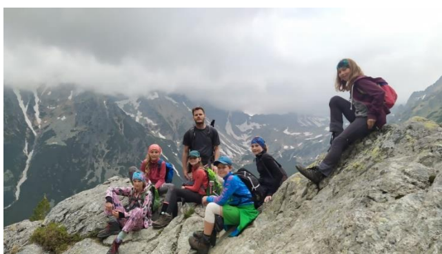
Výlet do Vysokých Tater II. T