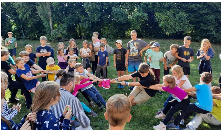
Pobytový adaptační kurz s námořnickou tematikou Vzhůru na palubu