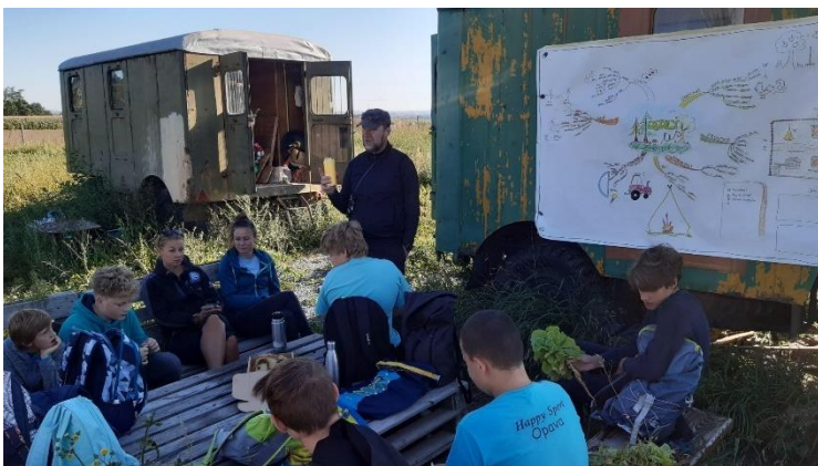
Projekt Jedlý les v Lučním sadu