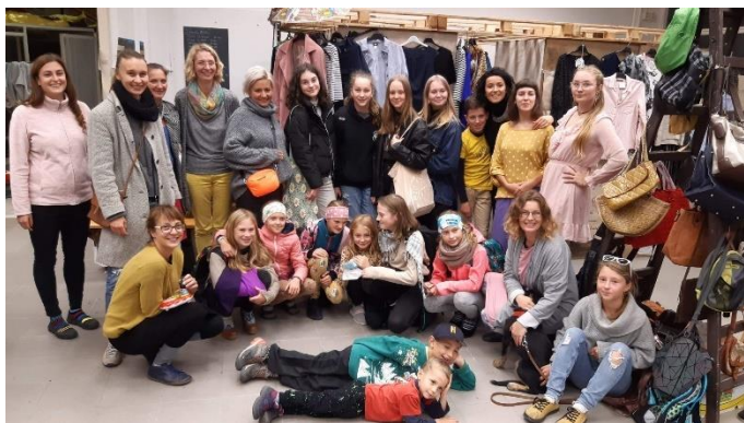
Zapojení do příprav dobročinného Fashion-café-music bazaru