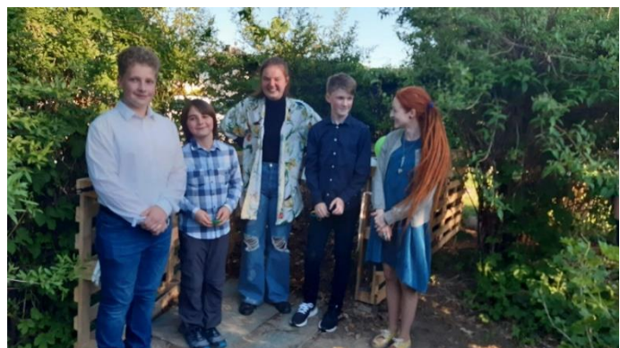
Projektové období v Jedlém lese a nový školní kompost