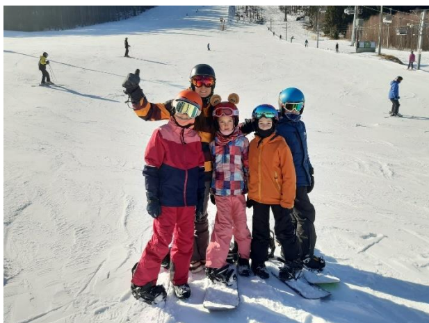
Lyžařský výcvik v Jeseníkách