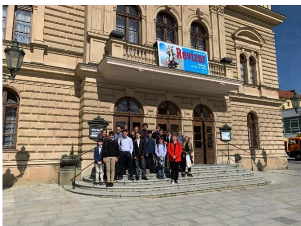
Návštěva Slezského divadla aneb etiketa pro III. T