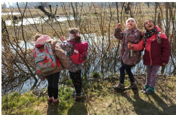
Výpravy „Labyrintíku“ do přírody - Kozmické ptačí louky