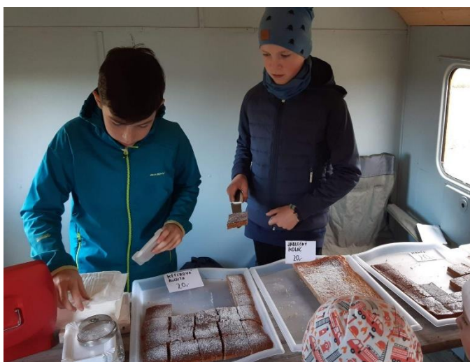
Kavárna v maringotce - účast dětí na sousedské slavnosti S láskou sklizeno