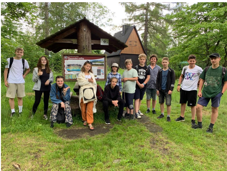
Táboření na Slezské Hartě (adolescentní program)