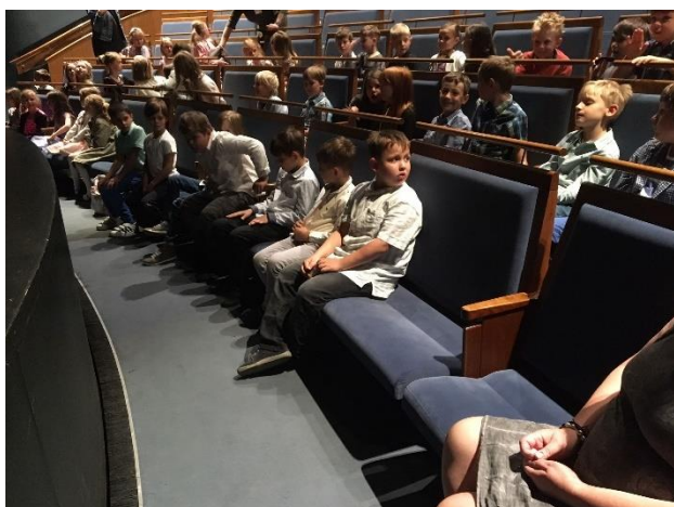
Výlet do Divadla loutek v Ostravě I. T