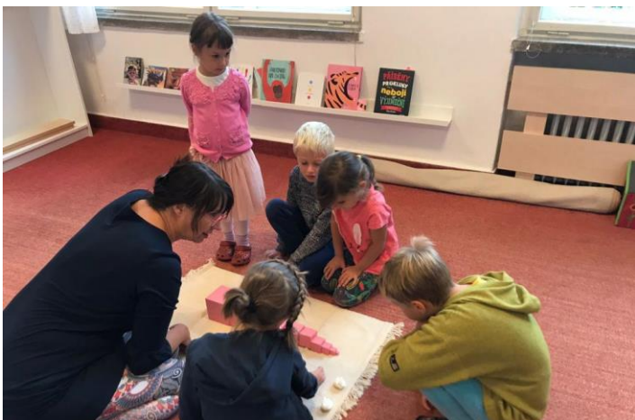
Nová přípravná třída Labyrintík