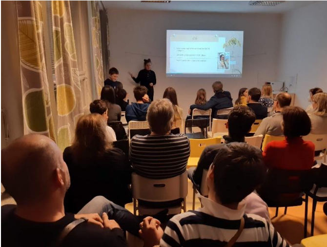
Vernisáž projektů III. T