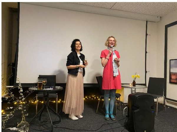
Jarní večírek pro rodiče a přátele školy