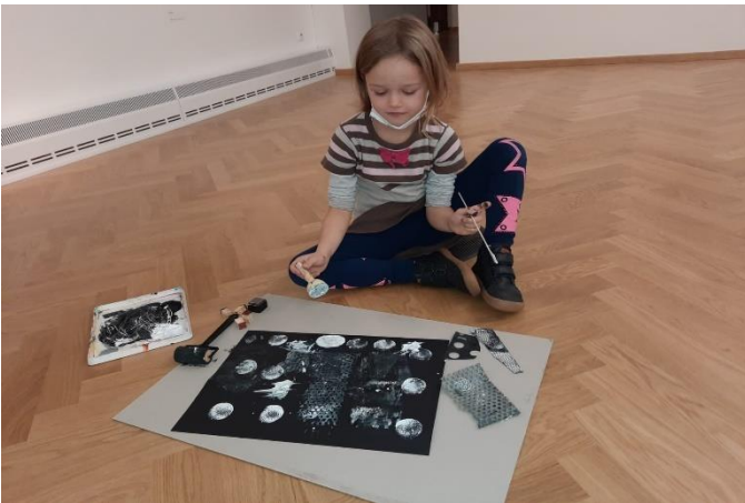
Animační program v Galerii výtvarného umění I. T