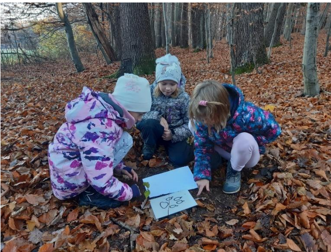
Ozdravný pobyt v Hostětíně I. T