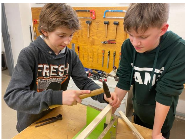
Den otevřených dveří