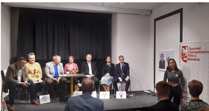
Účast III. T na předvolební debatě s regionálními lídry politických stran