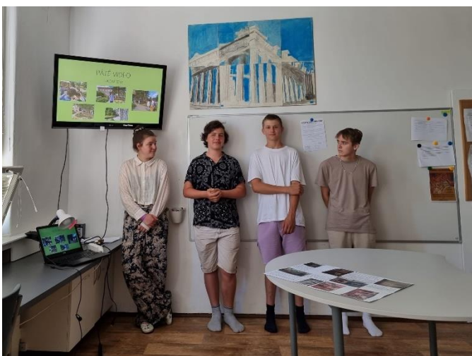
Absolventské projekty studentů 9. ročníku