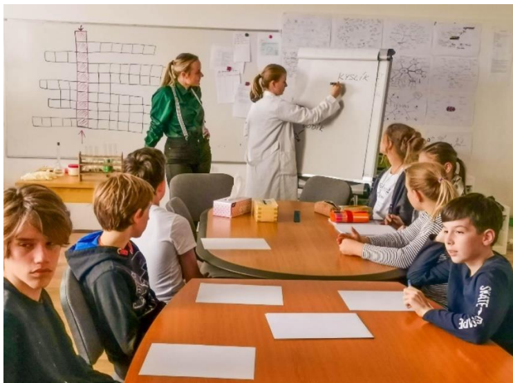
Spolupráce s Mendelovým gymnáziem Opava - výuka chemie a přírodních věd v rámci vrstevnického učení