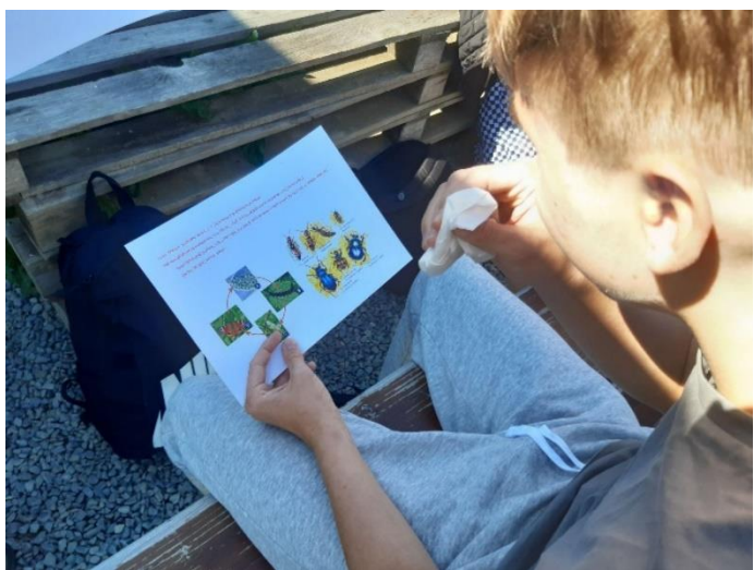
Badatelské dny v Jedlém lese