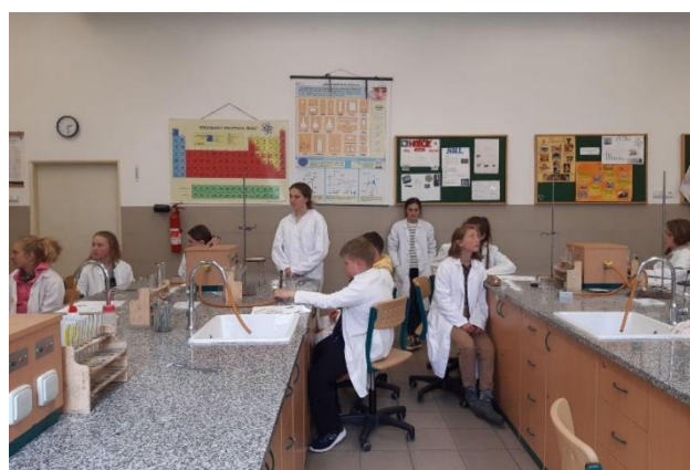
Lekce chemie na Mendelově gymnáziu v Opavě