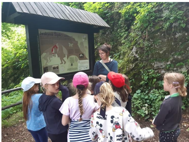
Výlet I. T do Štramberka