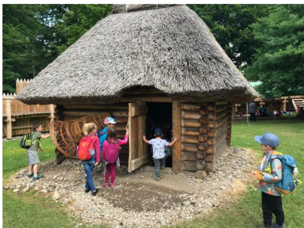
Výlet „Labyrintíku“ do Archeoparku v Chotěbuzi