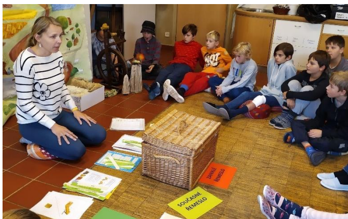
Výjezd II. T do Ekocentra Veronica Hostětín