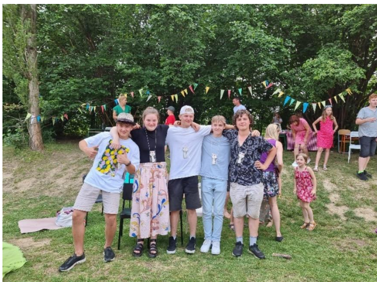
Absolventi Labyrintu 2022