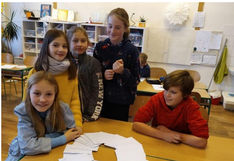
Maraton psaní dopisů pro neprávem odsouzené vězně v rámci kampaně Amnesty International